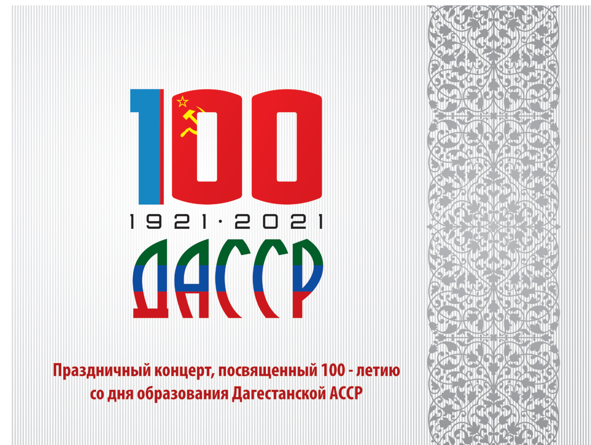
формат 3:4 (с дополнительным текстом)