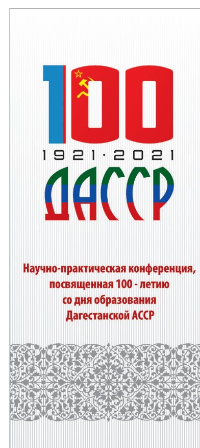
вертикальный формат 0,8 x 1,8 м