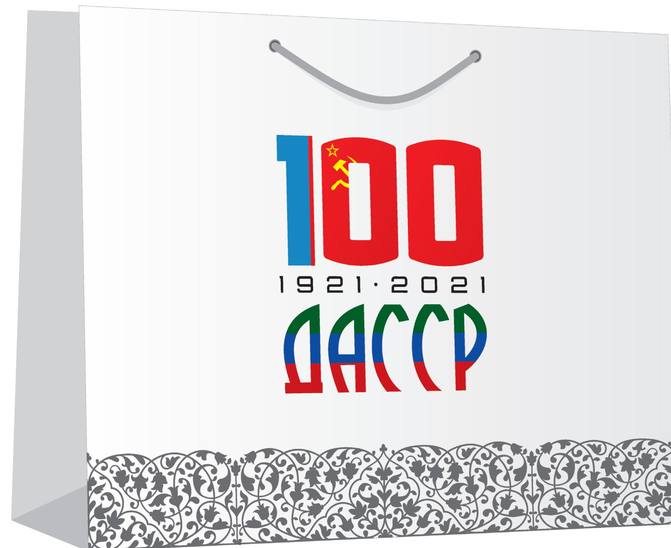
Картонный подарочный пакет (глянец), 40 x 30 x 8 см