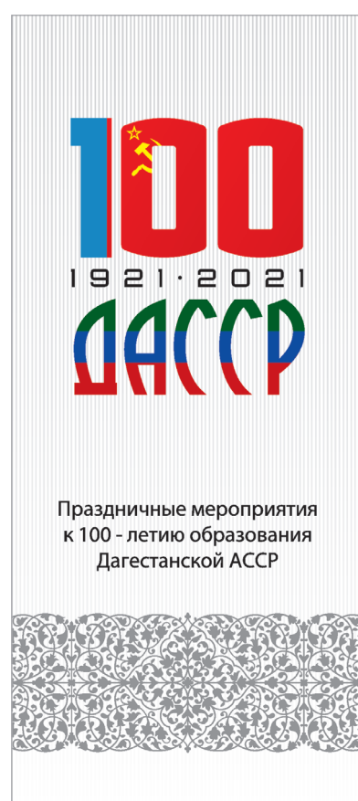
вертикальный формат 0,8 x 1,8 м