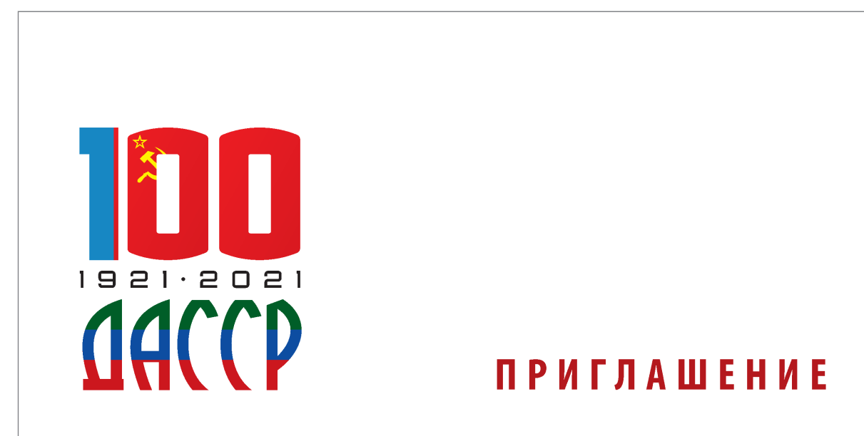
конверт 11 x 22 см (знак на белом фоне и без орнамента)