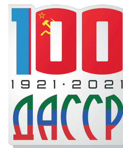
Магнит акриловый (уф печать на тыльной стороне прозрачного акрила, 50 x 60 мм)