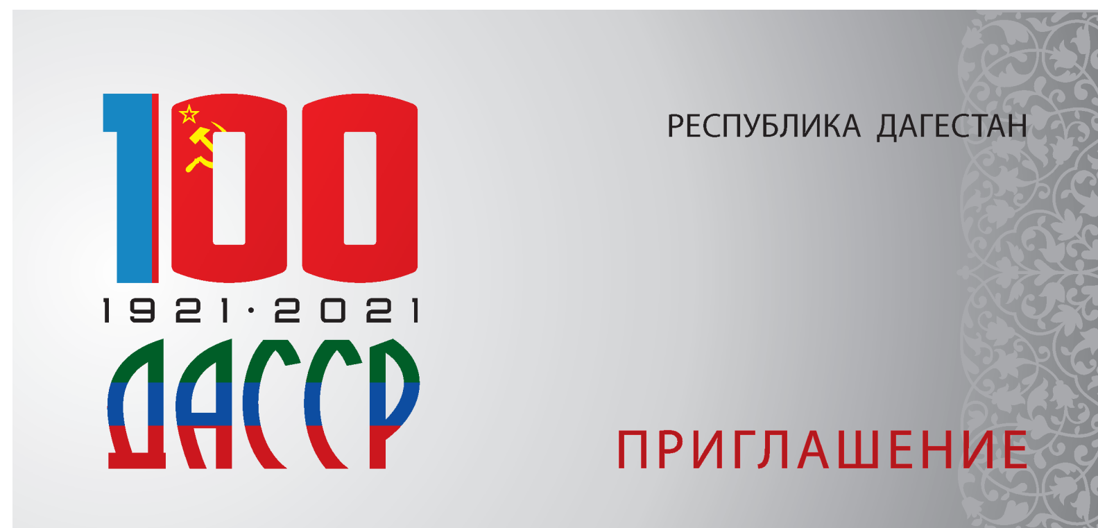
Макет пригласительного. Лицевая сторона для формата 420 x 100 мм, 1 сгиб