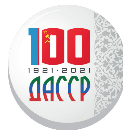
Средний нагрудный знак (металл, бумага, ламинат, Ø 37/50/56 мм)