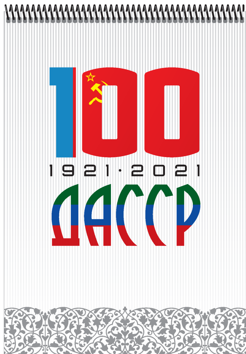
Блокнот формата а5/а6